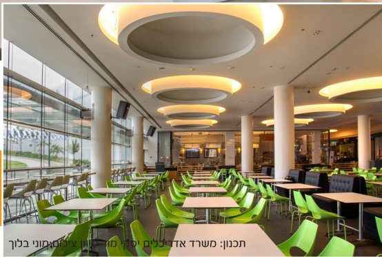
תכנון: משרד אדריכלים יסקי מור סיוון.