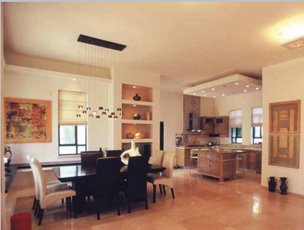
אורבונד - הכי מודולארי...